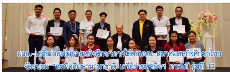
มวล.-เครือข่ายพัฒนาสหกิจศึกษาภาคใต้ตอนบน-สมาคมสหกิจศึกษาไทย จัดอบรม “สหกิจศึกษานานาชาติ เครือข่ายสหกิจฯ ภาคใต้ รุ่นที่ 1”